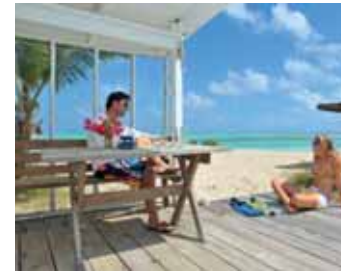
New Spot: Bonaire